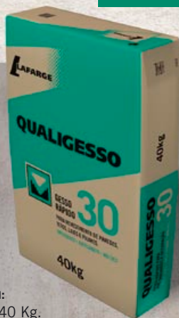
Embalagem: Sacos de 40 Kg.