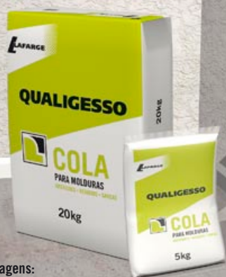
Embalagens: Sacos de 20 e 5 Kg.