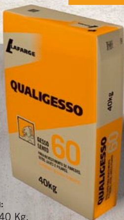
Embalagem: Sacos de 40 Kg.