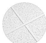
FINE FISSURED Square Lay-In com perfil PRELUDE tipo "T" de 15/16"