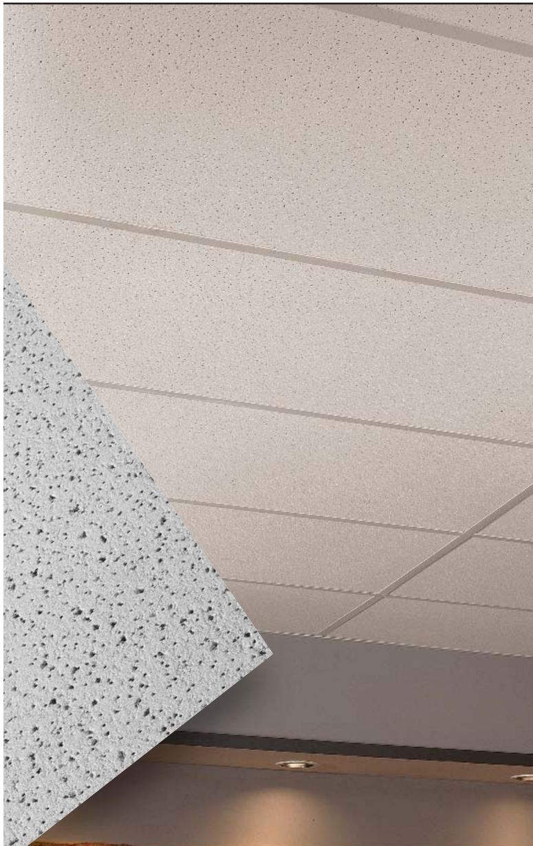
FINE FISSURED com perfil PRELUDE® tipo "T" de 15/16"