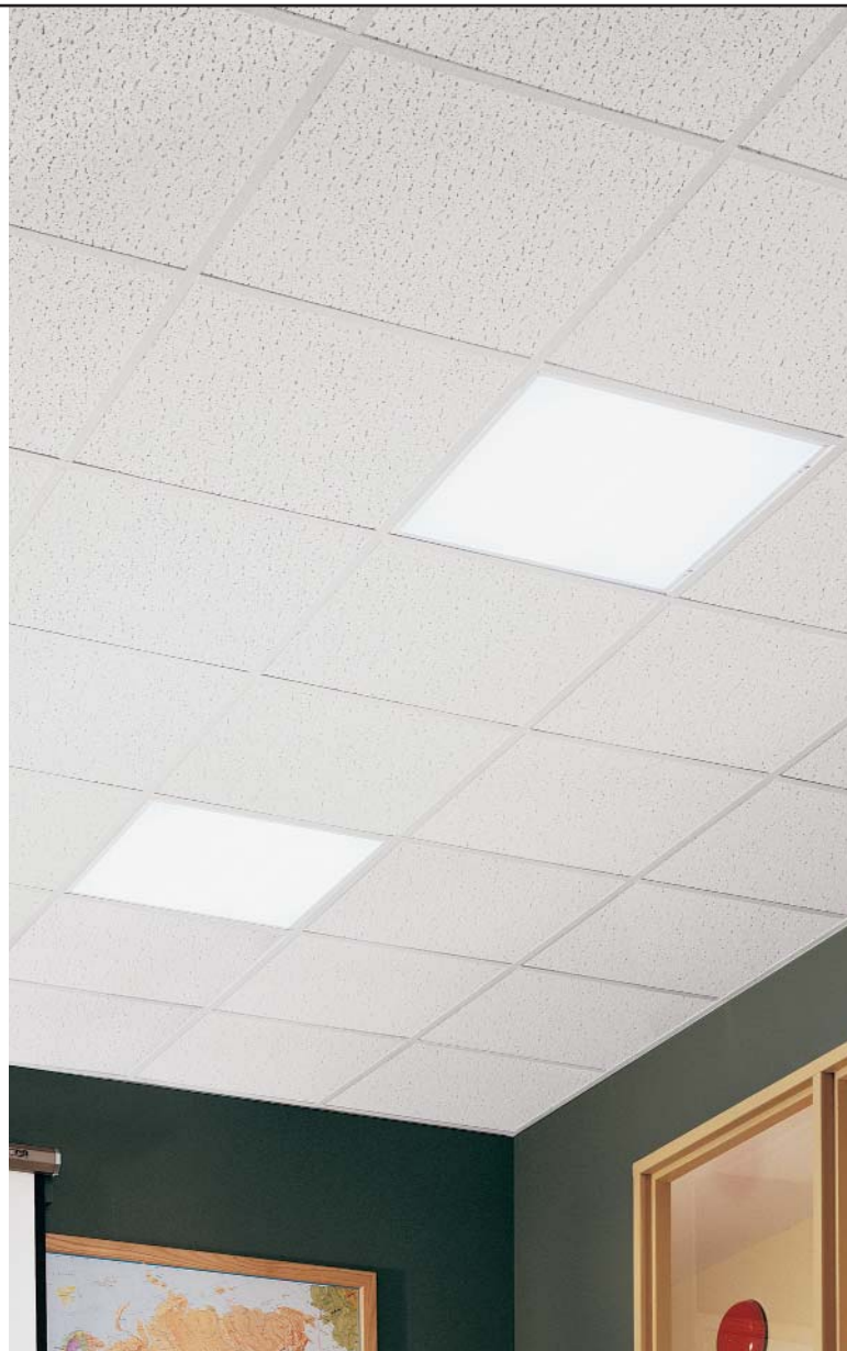
FINE FISSURED com perfil PRELUDE tipo "T" de 9/16"